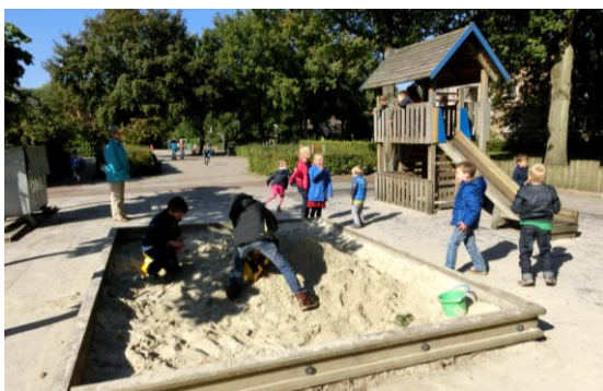
10. Buiten is het goed toeven.... Een middagje overblijven bij de Jan Thiesschool