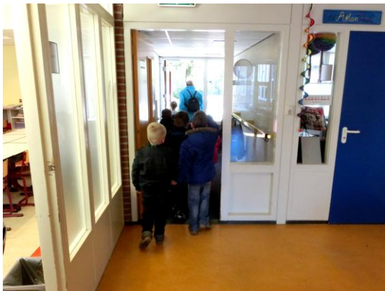
08. Na de boterham en wat drinken lekker naar buiten.