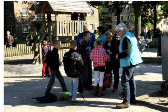
05. De kinderen van de groepen 3 t/m 8 worden buiten opgewacht.