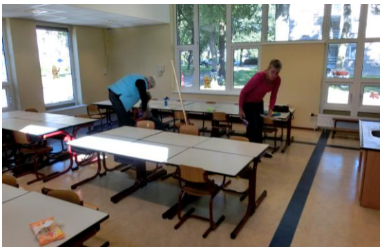
09. De overblijfskrachten maken de lokalen weer schoon.