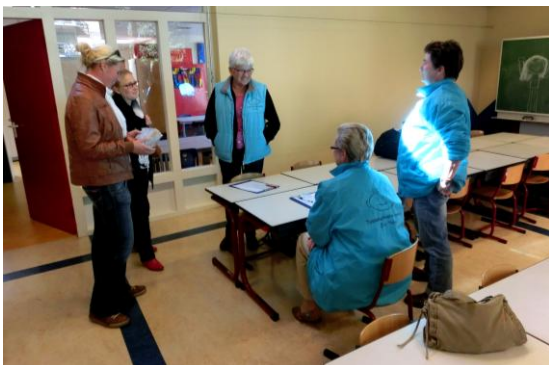
03. Nog even de laatste zaken doorspreken.