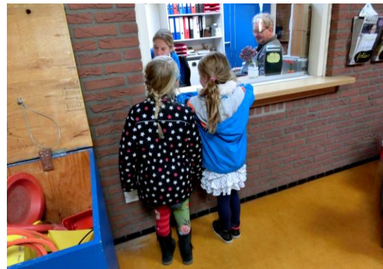
11. En een eerlijke vinder geeft alles af... in dit geval... een gummetje!