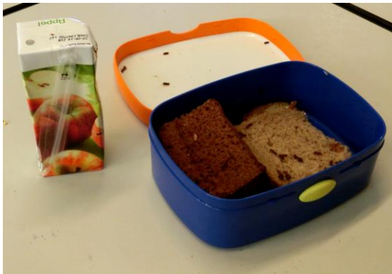
07. Een "doorsnee" lunch.