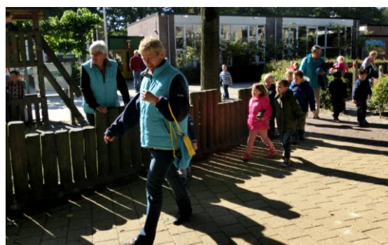
14. En dan gaat iedereen weer terug naar zijn of haar klas.