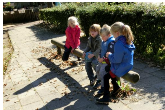
13. Nog even gezellig nakeuvelen...