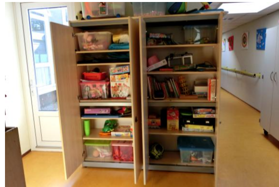
12. Voor als het slecht weer is, hebben we de beschikking over een royale kast met binnenspeelgoed.