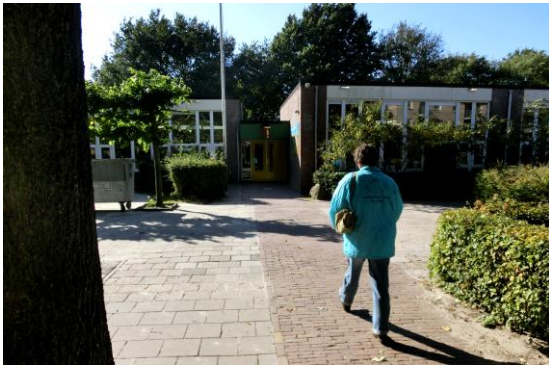
01. Om 11.45 uur arriveren de overblijfkrachten.