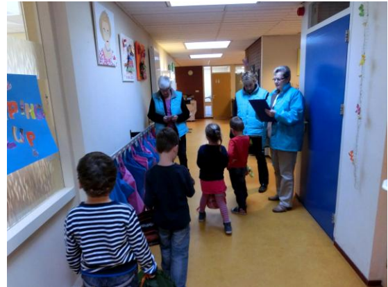
04. De kleuters worden in de gang al opgevangen.