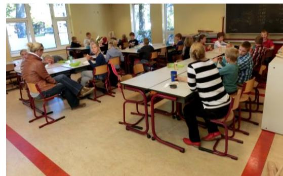
06. Voor het overblijven zijn de twee "voormalige kleuterlokalen" en een wisselokaal beschikbaar.

Een middagje overblijven bij de Jan Thiesschool